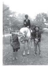
①競技会出場時の私と家内と

また競技会だけでなく、乗馬技術の5級から1級までの検定会もあり、私は現在馬場3級を持っており、練習を続けて2級にトライしたいと思っています。