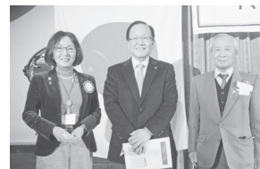
ロータリー大河の系図 地区研修委員会